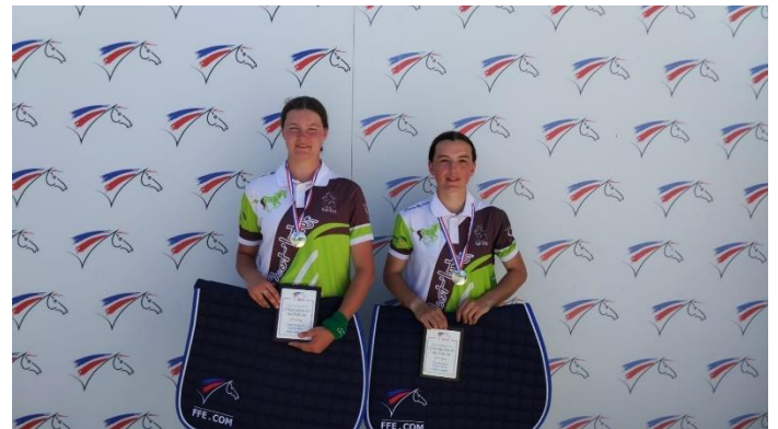
Une de nos cavalière (à droite) Vice-Championne de France de Pony-Games