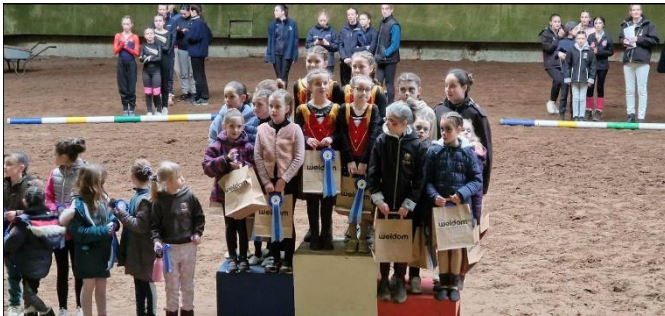
Nos médaillés au Championnat de la Manche de voltiae