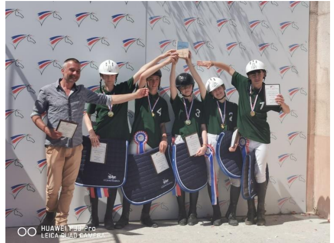
Nos Champions de France de Horse-Ball