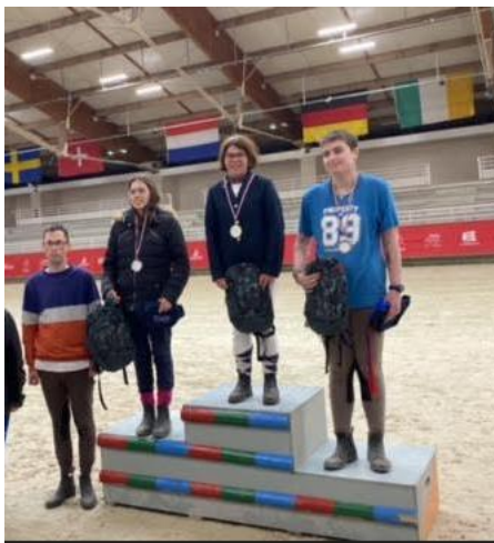
Notre médaillée au Championnat régional d'équitation adaptée