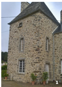
1. Le Vrétot, manoir du Danois